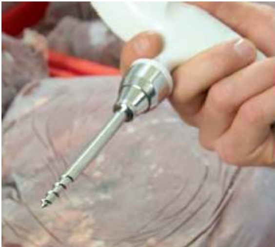
Specjalna , wymienna sonda pomiarowa do mrozonek