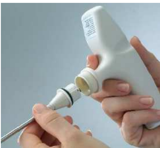
Łatwa do wymiany głowica sondy